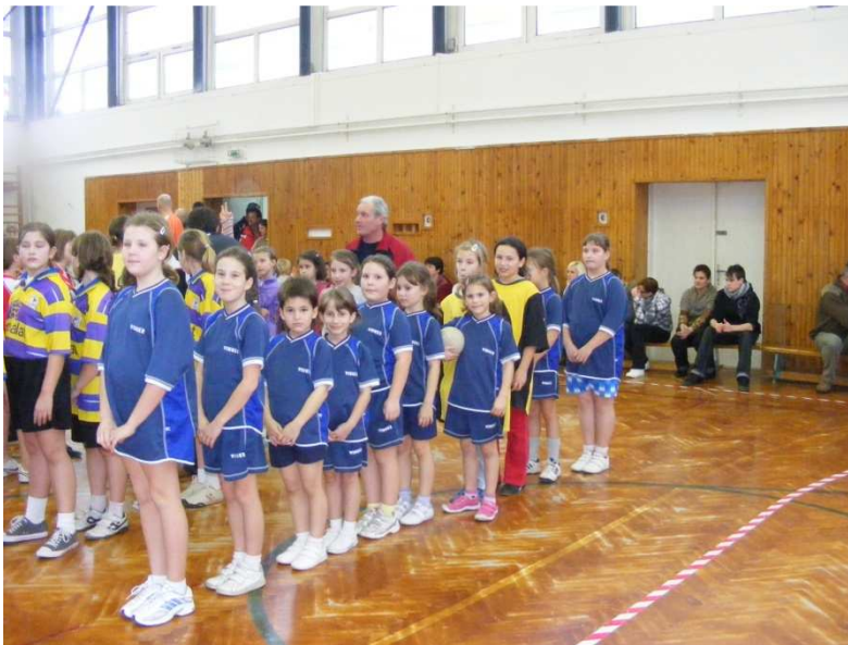
A szivacskezilabdázók lelkes csapata

Intézményünk tantestületének tagjai szakképzett, tapasztalt tanítók, szaktanárok. Alapos, gondos felkészítésük eredményeként tanulóink megállják helyüket későbbi tanulmányaik során is. Diákjaink rendszeresen jó eredménnyel képviselik iskolánkat a körzeti, városi, megyei, országos szaktárgyi és sportversenyeken.