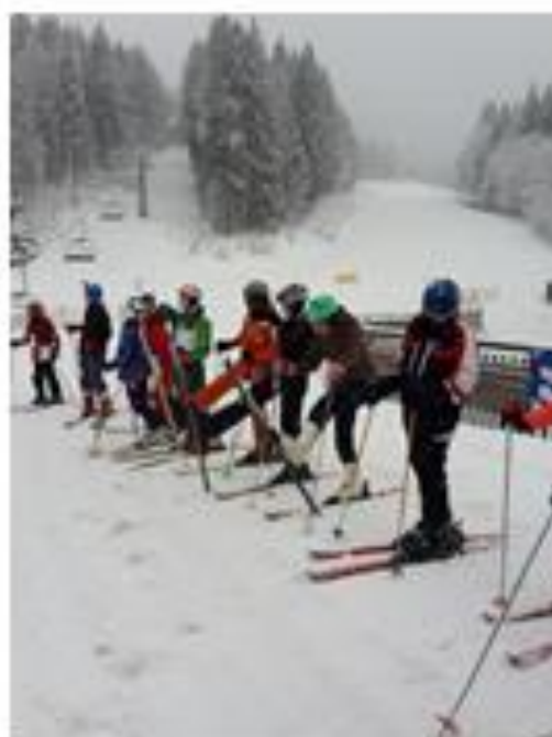
Sí tábor 2016

Évek óta sikeresen szervezzük a hetedikesek sítáborozását . Eddig Szlovákiába utazhattak tanulóink, az idei tanévtől pedig Ausztriában kerül sor erre a programra.