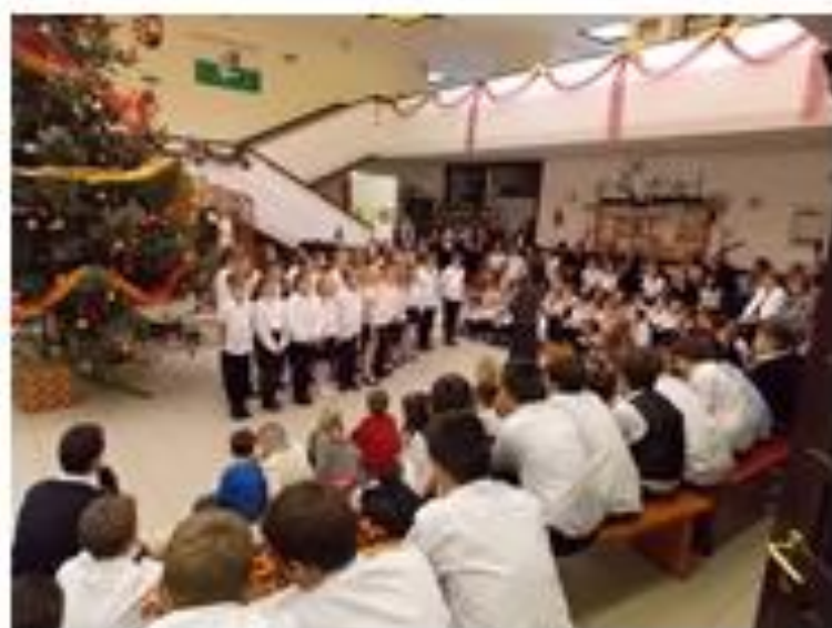
Karácsonyi műsor az iskolában