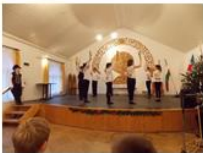
Néptáncosaink színesítik az iskolai ünnepek programjait