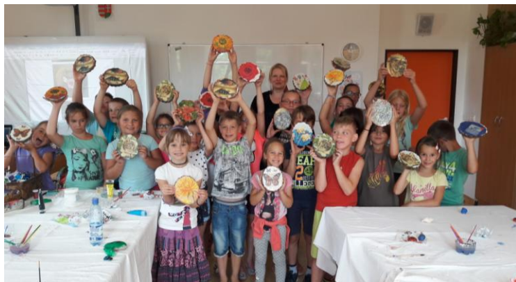
Kézműves tábor 2017

Tanulóink szüleinek havonta fogadóórákat tartunk.