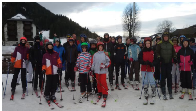
Sí tábor 2017

Iskolánk több külföldi intézménnyel tart fenn partnerkapcsolatot, tanulóink barátkozhatnak szlovén, svéd, lengyel és felvidéki gyerekekkel is. Évek óta sikeresen veszünk részt a Határtalanul pályázaton, melynek keretében az idei tanévben Erdélybe utazhatnak a hetedikes tanulók.