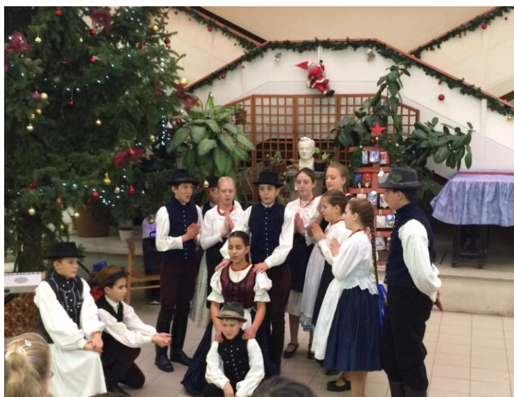
Karácsonyi műsor az iskolában