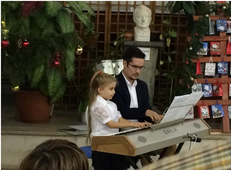
Zeneiskolások karácsonyi hangversenye

A tapolcai Járdányi Pál Zeneiskola kihelyezett tagozata működik iskolánkban, így mód nyílik a zenei képzésre. Itt tanulhatják a gyerekek a szolfézszt, illetve a zongora illetve furulya oktatás is helyben valósul meg.