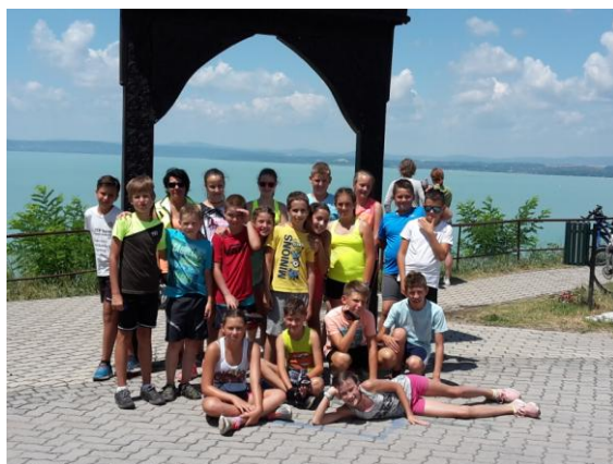
Kerékpáros tábor 2017

7-8. osztályosainknak felvételi előkészítőt tartunk matematika, magyar és angol nyelv tantárgyból. Tábort és igény szerint nyári napközit is szervezünk.