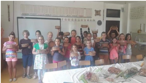
Kézműves tábor 2018

Tanulóink szüleinek havonta fogadóórákat tartunk.