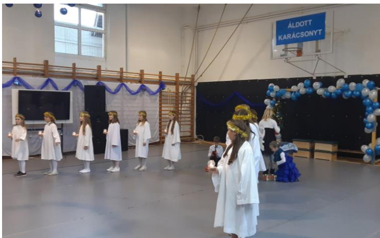
Karácsonyi műsor az iskolában