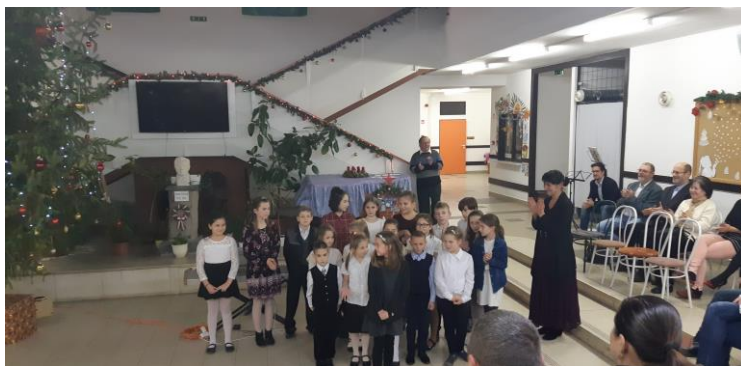
Zeneiskolások karácsonyi hangversenye

A tapolcai Járdányi Pál Zeneiskola kihelyezett tagozata működik iskolánkban, így mód nyílik a zenei képzésre. Itt tanulhatják a gyerekek a szolfézst, illetve a zongora és furulya oktatás is helyben valósul meg.